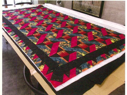
製作中の作品「金環日食」